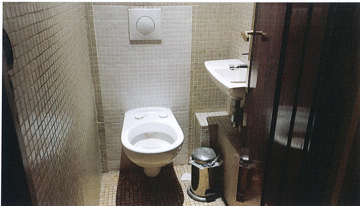
Sanitaires hall d'entrée.