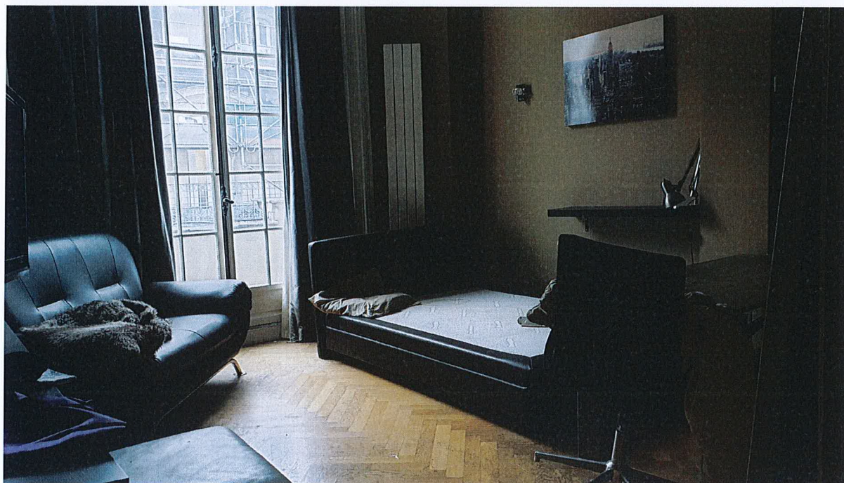
Première Chambre sur la rue Georges Ville.