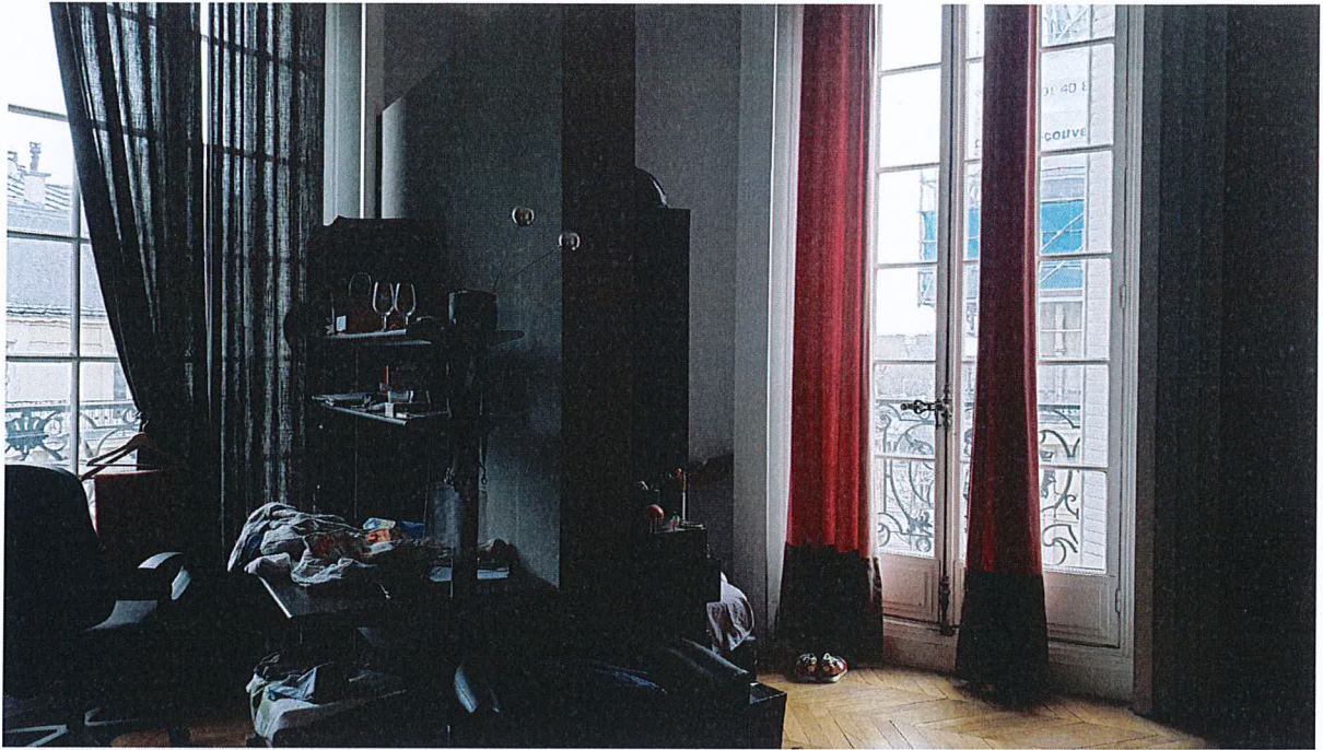
Chambre d'angle Victor Hugo Georges Ville.