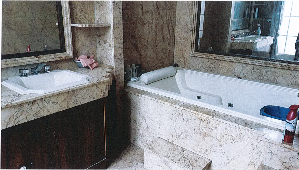
Salle de bains attenante à cette chambre.