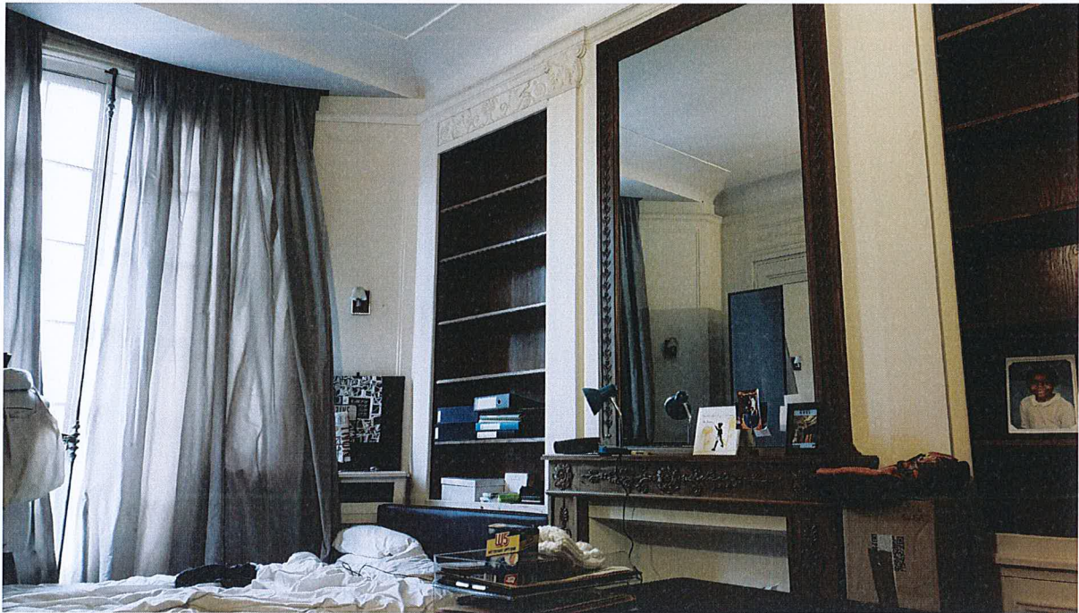
Troisième chambre sur la rue Georges Ville.