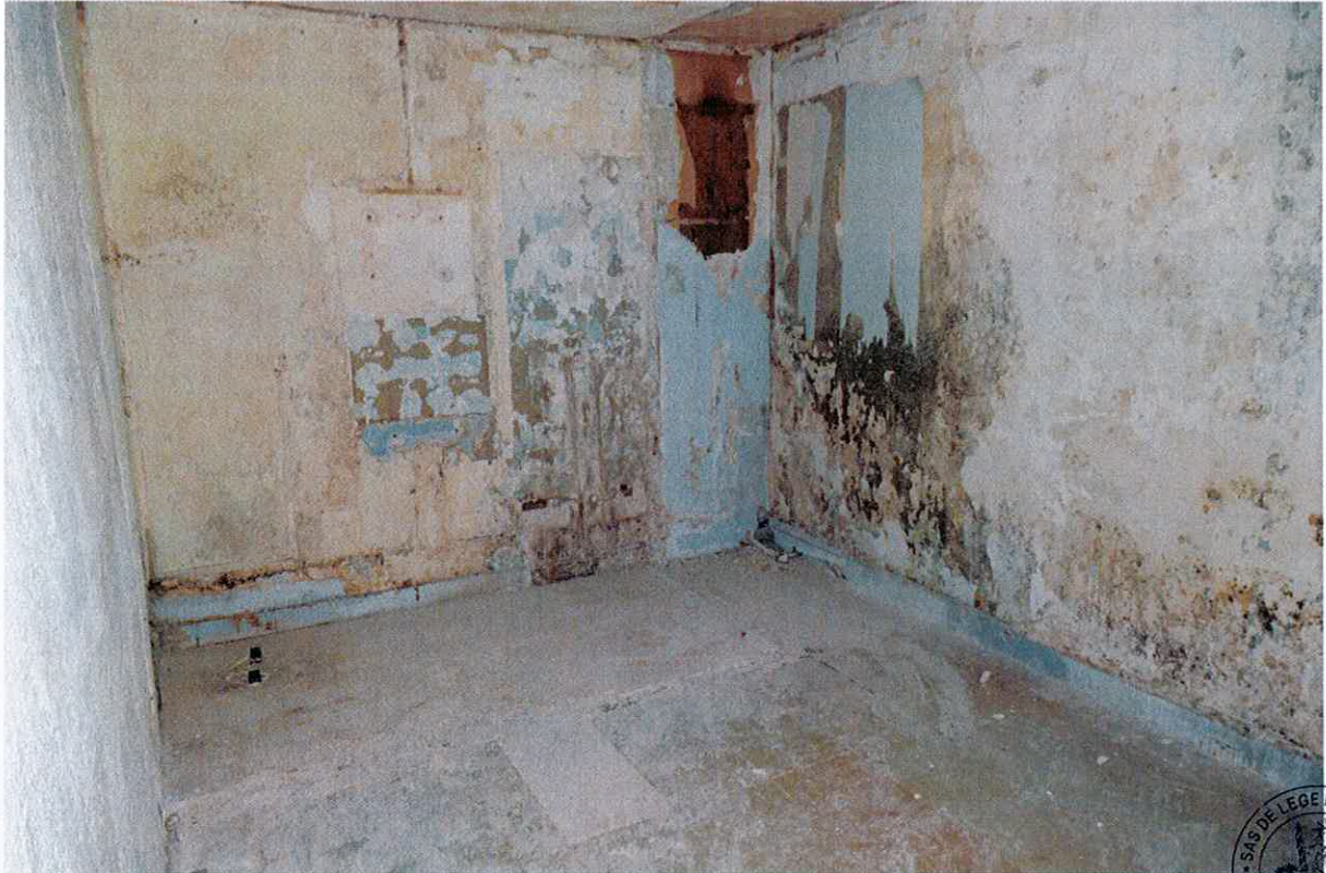
15 Pièce 2