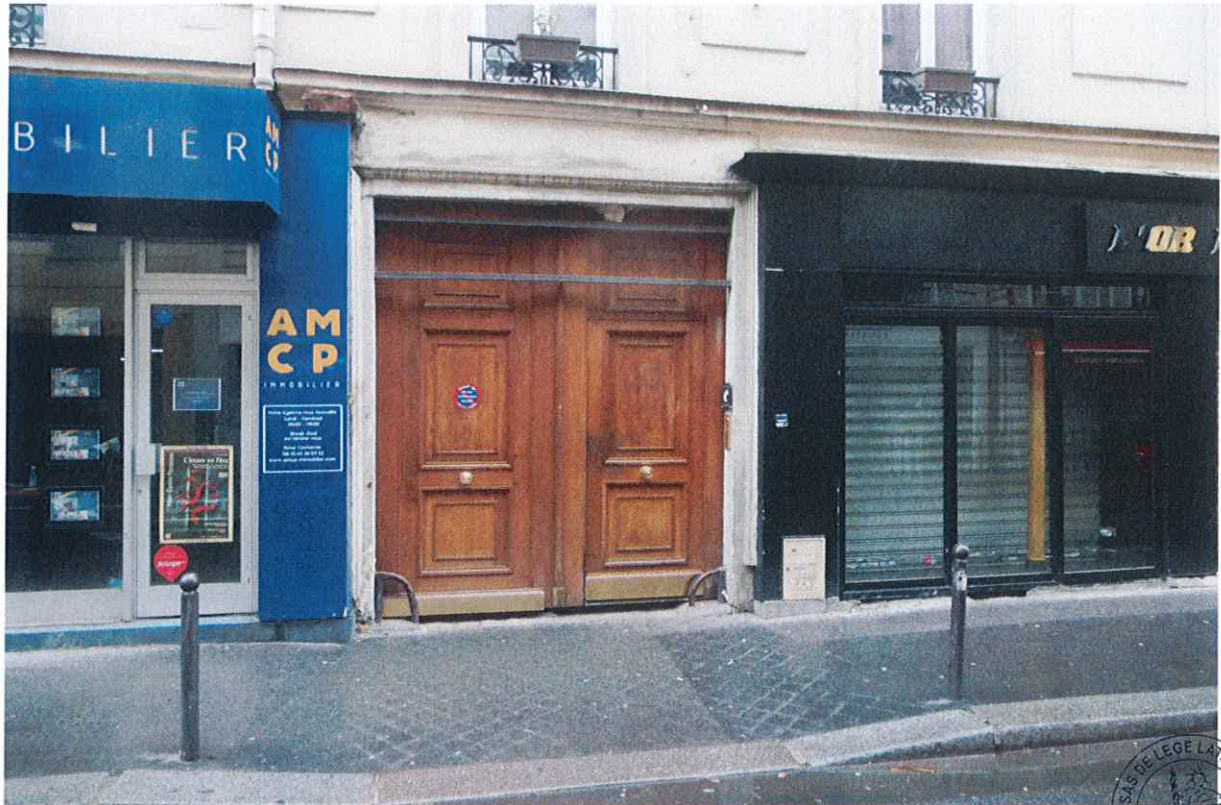
1 40, Sedaine P11