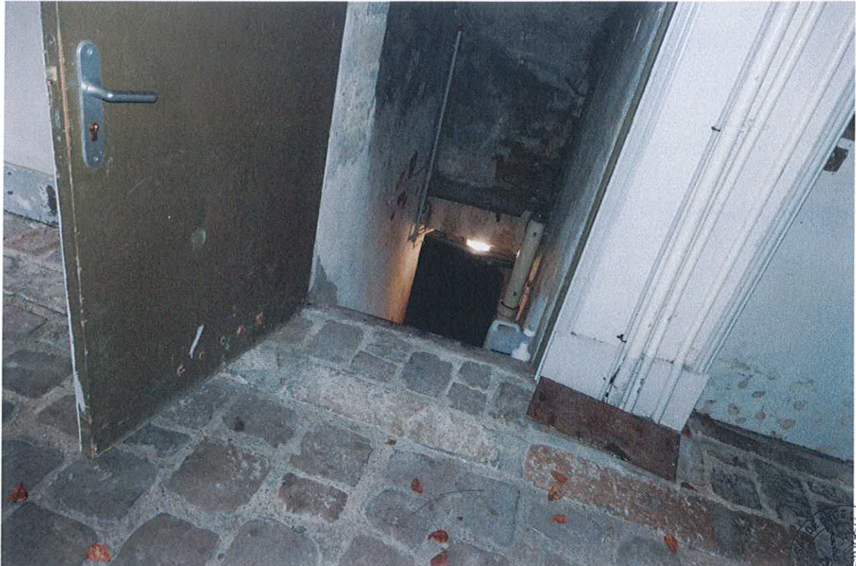
17 Accès caves