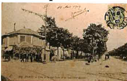
Angle rue Didot et boulevard Brune, le tramway, en 1907.

La partie de cette rue située entre la rue du Château et la rue du Moulin-Vert est une section de l'ancienne « rue du Terrier-aux-Lapins » située sur la commune de Montrouge avant son rattachement à la voirie de Paris en 1863. Cette rue longeait le domaine de l'ancien château du Maine disparu à la fin du xix e siècle . Elle fut prolongée de la rue du Moulin-Vert à la rue d'Alésia en 1874.